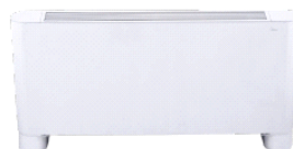
Spodní příívod vzduchu